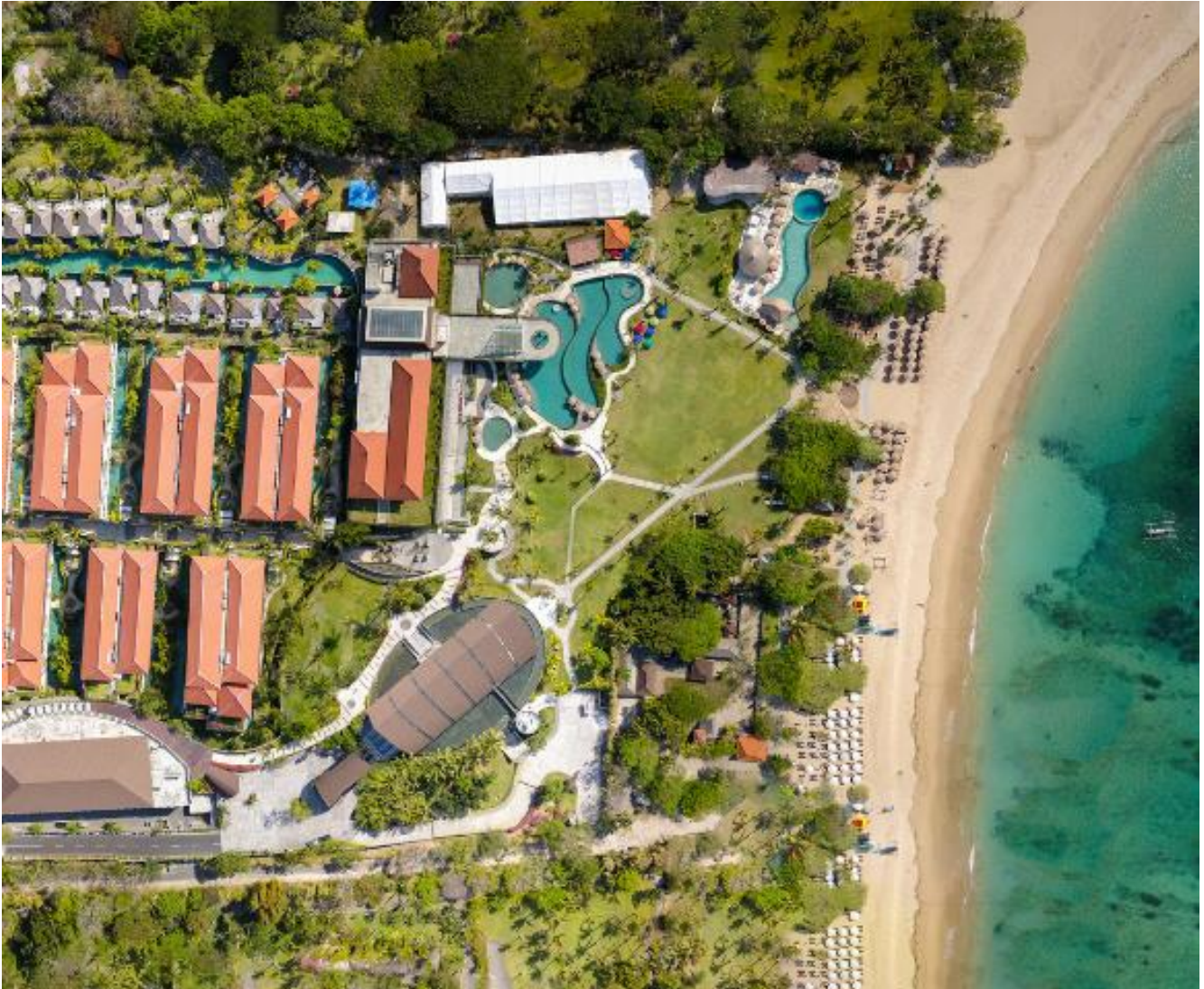
Vista Aérea de Merusaka Hotel